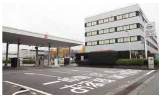
日産車体工場入口

高速道路よりお越しの場合 ・圏央道 寒川南ICから 約10分 ・中央道 甲府南ICから 約1時間30分 ・関越道 川越ICから 約1時間10分